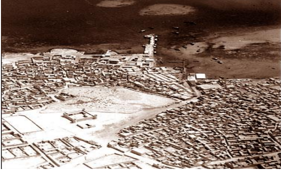
شكل (1) صورة جوية لمدينة الدوحة عام 1947

(3) النسيج العمراني الحديث لمدينة الدوحة: أدت السياسات التصميمية الحديثة إلى تشجيع الزحف بالاتجاه الشمالي والغربي من المدينة من خلال تقنيات التسهيلات الحضرية الحديثة، وتطوير المناطق التجارية الحديثة، وإنشاء مراكز فيها. وشمل قلب المدينة معظم الفعاليات التجارية في مبانٍ متعددة الطوابق ذات توسع عمودي مفرط ضمن مركز المدينة الحديث، وإعادة تسقيط الأبنية الإدارية في المدينة. في حين تلاشى النسيج الحضري للمدينة القديمة واستبدل بتخطيط هندسي وأصبحت وسائل النقل مقياسه الأساس في التكوين المستحدث.