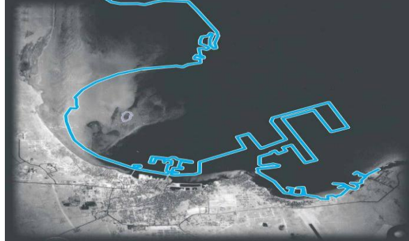
شكل(2) صورة جوية لمدينة الدوحة عام 1971

Innovation Center for Design and Technology, Qatar National Council for Arts and Culture, 2003,